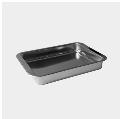
PLATO ITALIANO PEQUEÑO