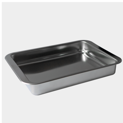
PLATO ITALIANO GRANDE